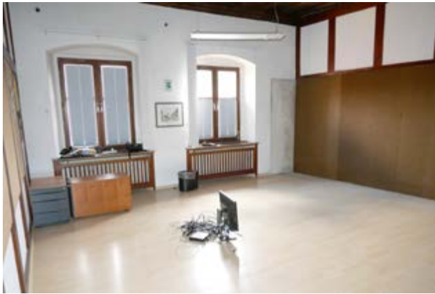
Nur noch leere Räume im Rathaus.