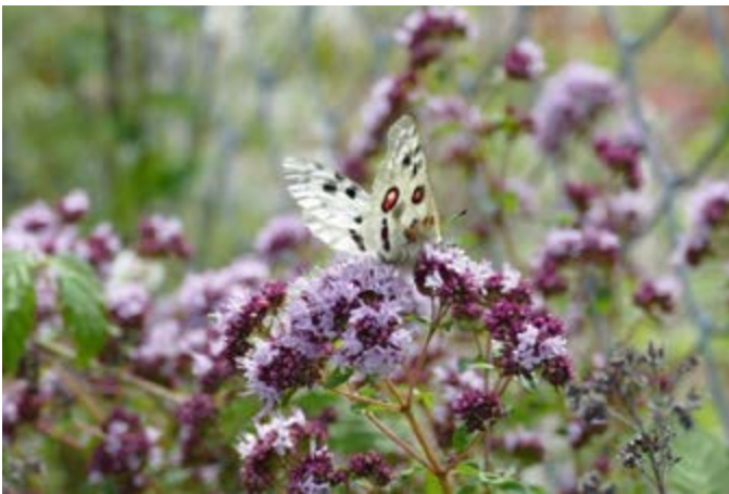
Apollofalter – Foto R. Werner, 2020

Unser wichtigstes Anliegen: die Artenvielfalt und den unvergleichlichen Reiz unserer Kulturlandschaft auch für spätere Generationen zu erhalten. Gemeinsam mit der heimischen Landwirtschaft, dem Naturschutz und den Kommunen. Der Aktionsbereich unseres Landschaftspflegeverbands ist der Landkreis Lichtenfels. Wer mit dem Landschaftspflegeverband zusammenarbeitet, tut dies freiwillig. Wir suchen Unterstützung zur Durchführung landschaftspflegerischer Maßnahmen rund um Weismain und dem Kleinziegenfelder Tal. Zusammen mit regionalen Landwirten mit langjähriger Landschaftspflegeerfahrung sind beispielsweise Felsfreilegungen, die Entbuschungen von Magerrasen und Wacholderheiden oder Hecken- bzw. Kopfweidenpflege durchzuführen. Allrounder mit Gerätschaften zur Landschafts-