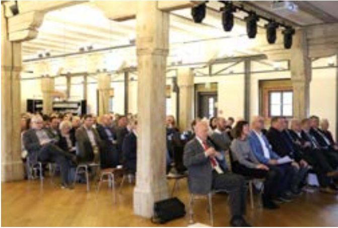
Volles Haus: Feier zum 30. Geburtstag der Schule für Dorf- und Flurentwicklung, Klosterlangheim.

Die SDF Klosterlangheim ist die fränkische der drei bayerischen Schulen. Dabei ist sie keine Schule im eigentlichen Sinn, sondern vielmehr eine Bildungsstätte, in der die Teilnehmenden in Workshops und Seminaren zur aktiven Mitarbeit in der Dorferneuerung, der Flurneuordnung und der Integrierten Ländlichen Entwicklung (ILE) motiviert werden. Die SDF unterstützt seit drei Jahrzehnten mit ihrem Angebot erfolgreich bürgerschaftliches Engagement und Eigenverantwortung.