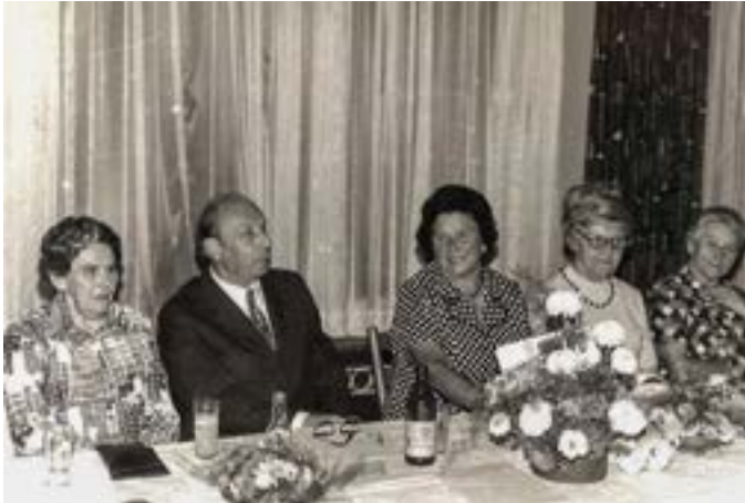
Feier des 20jährigen Jubiläums der Evangelischen Frauenhilfe am 28. August 1973 im Café Jahn

mehr. „Es ist schön, dass die Frauenhilfe an das Stadtarchiv gedacht hat“, freut sich die Archivarin. „So bleibt ein Stück Weismainer Geschichte zukünftigen Generationen erhalten.“