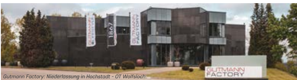
Gutmann Factory: Niederlassung in Hochstadt - OT Wolfsloch.